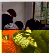
同学们在线下门店实训场景